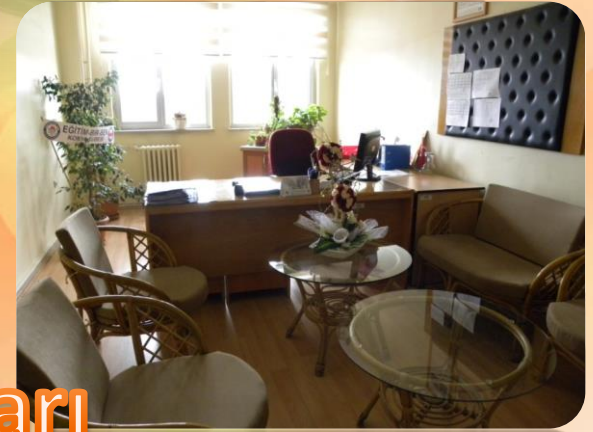
Müdür Yrd. Odaları